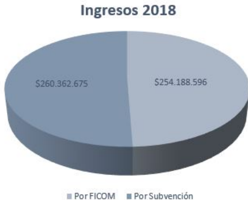
Figura 1: Ingresos

Lo que nos muestra la figura 1, es que por una leve diferencia, los valores aportados por los padres son menores a los aportados por la Subvención General del Estado. La sumatoria de ambos nos da cuenta de ingresos anuales por la suma de $514.551.271 (quinientos catorce millones quinientos cincuenta y un mil doscientos setenta y un pesos). Este valor podría variar muy levemente por alguna reliquidación de años anteriores o algún valor menor no incluido en este estudio.